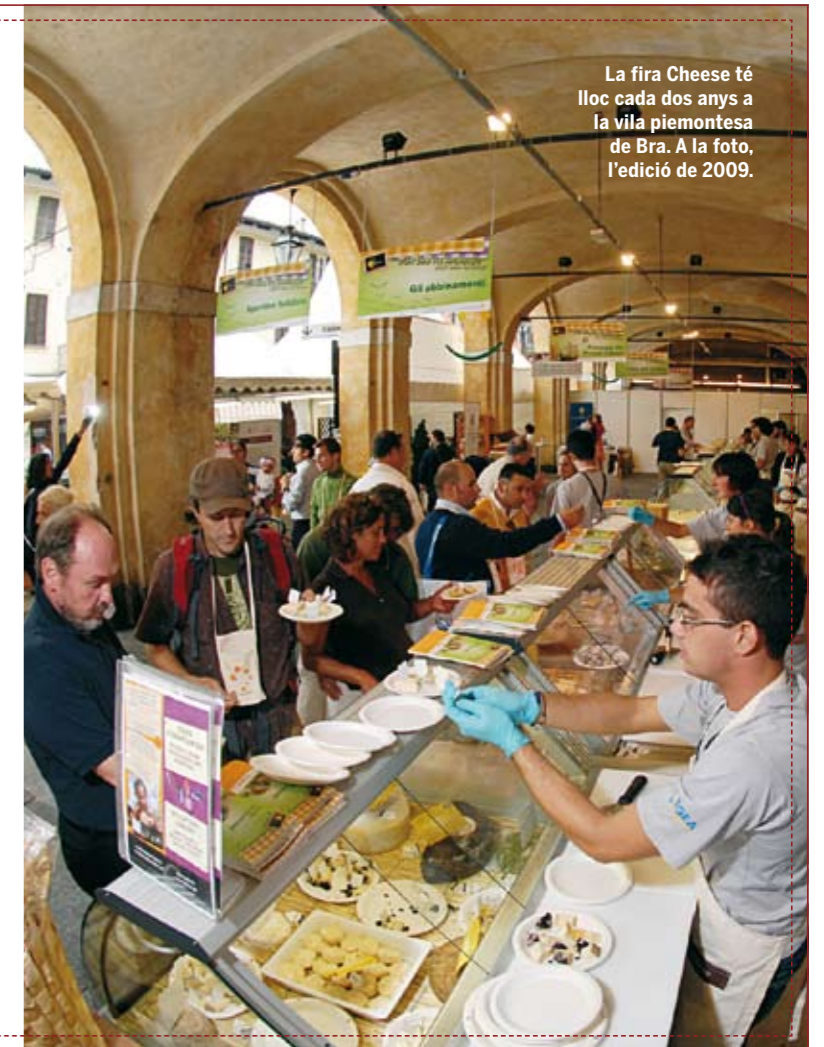
La fira Cheese té lloc cada dos anys a la vila piemontesa de Bra. A la foto, l'edició de 2009.

Castelmagno d'Alpeggio, al Piemont, Bagòss de Bagoino, a la Llombardia, Formadi Frant, a la regió del nord de Friuli, i Fiore Sardo, dels pastors de l'illa de Sardenya. Són alguns dels formatges italians en perill d'extinció i que Slow Food ha ajudat a salvar. L'octubre passat, a Bra, una ciutat del Piemont on té la seua aquesta associació, va tenir lloc la Cheese 2009, una fira d'aquests formatges "bons, nets i justos". En el certamen hi van participar 60 formatges italians i estrangers, i van rebre la visita de 160.000 persones, de les quals 50.000 no eren italianes. La cita té lloc cada dos anys, per la qual cosa la pròxima edició serà el 2011. Si mentrestant voleu aprofundir en el coneixement d'aquests productes, en podreu gaudir al Saló del Gust, el certamen més important amb segell Slow Food, que tindrà lloc del 21 al 25 d'octubre a Torí. www.salonedelgusto.com